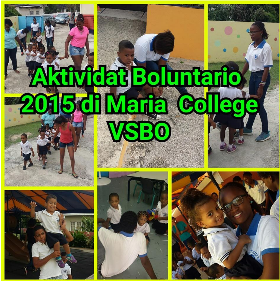
Maria College ta bria ku su aktivitatnan boluntario dia di enseñansa.