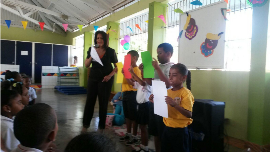
Sta. Rosa de Lima College ta tende kuenta den siman di lesa.