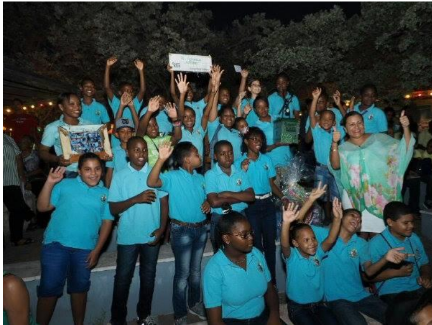
St. Antonius College a bria ku e proyekto di Green Kidz. Nan a bai ku tur tres premio. Pabien na st. Antonius, ban sigui plama e notisia kon pa hasi Korsou tur dia mas bèrde.