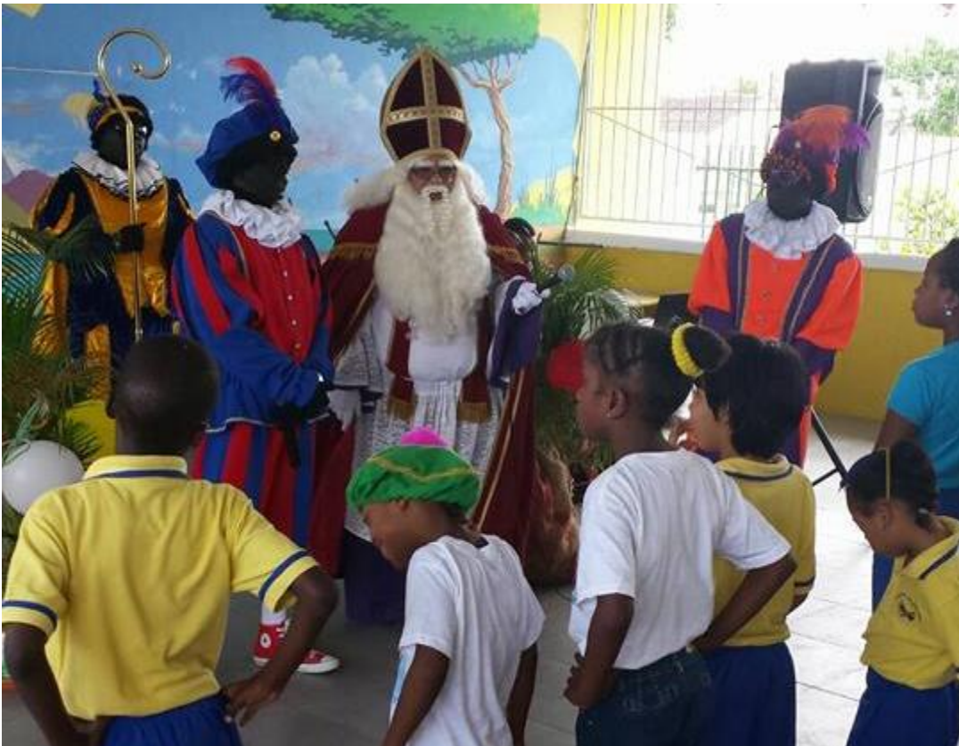
Selebrashon di sinterklas na Kolegio Sur Herman Jozef