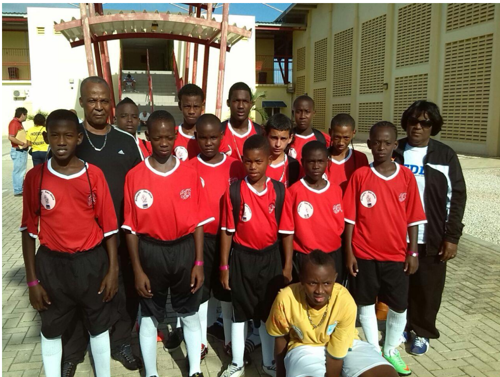
Tim kampion di Kolegio San Hose ku a gana futbòl na Kòrsou i a representá nos na Aruba. Pabien na e hóbenan i na personal di Kolegio San Hose.